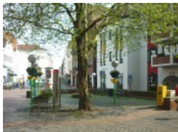
Der Kaak mit Blick in Richtung Obermarktstraße