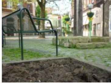
Eine andere Sicht auf den kleinen städtischen Platz

Abbildungen - Das vorbereitete Beet noch vor der Bepflanzung und ohne die drei Pflanzkästen