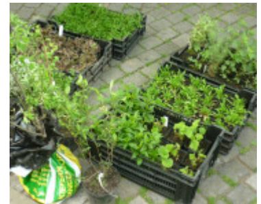
Die Pflänzchen für das Kaak-Beet