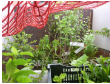
Setzlinge noch auf dem Hänger