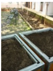
Zwei der Pflanzkästen mit Erde befüllt von oben