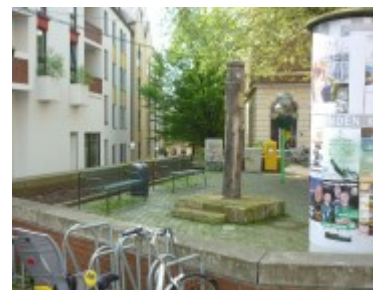
Der Kaak mit der Litfasssäule und dem Fahrradständer