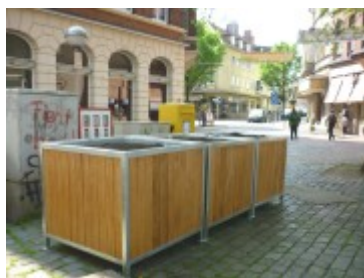
Die Pflanzkästen am Kaak nahe der Königstraße