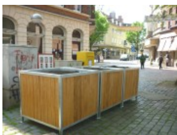
Die Pflanzkästen am Kaak nahe der Königstraße