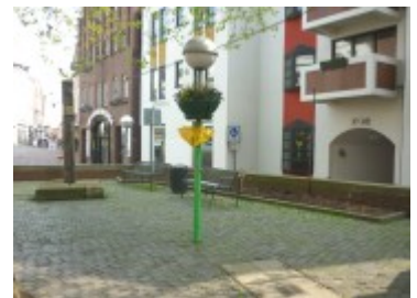
Links der Pranger, im Hintergrund eine Häuserfront