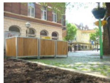
Im Vordergrund das lange Hauptbeet