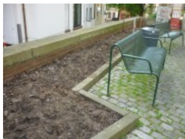
Das Beet am Kaak in voller Länge